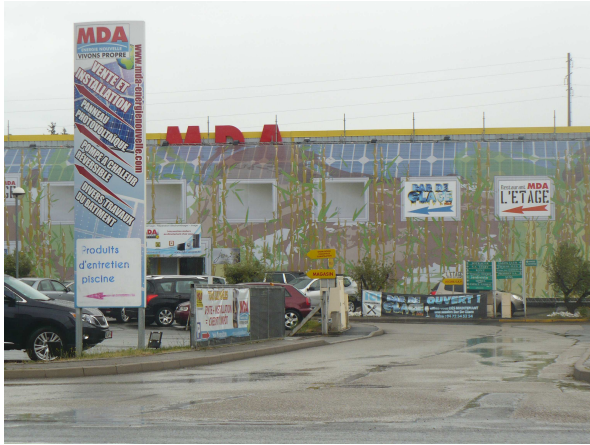
Prolifération d'enseignes magasin MDA

l'arrivée dans la 1 ère commune des Pierres dorées et du Beaujolais. En ce sens, une étude est actuellement en cours avec le Conseil général du Rhône pour revoir totalement cette entrée de village, avec notamment l'implantation d'une voie de déplacement doux et une forte végétalisation.