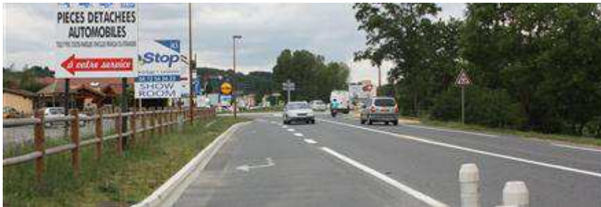
Prolifération d'enseignes Route de Lyon

Afin d'éviter cette multiplication, le nouveau règlement pourrait prévoir notamment l'obligation, lorsque plusieurs commerces se trouvent sur la même unité foncière, de n'avoir qu'une seule enseigne regroupant toutes les activités.