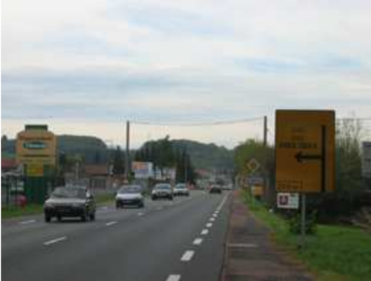
Entrée depuis Lyon vers Lozanne